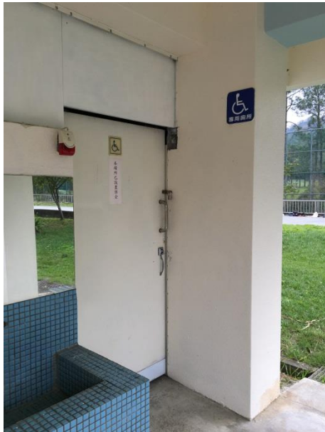
說明：校園無障礙廁所及設施標示