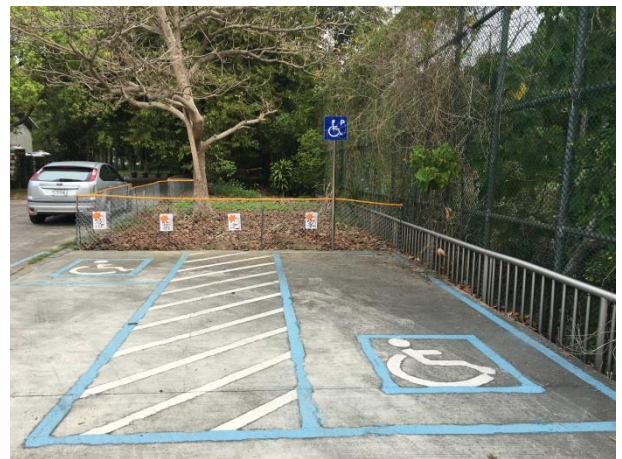
說明：校園無障礙停車格、標線及設施標示