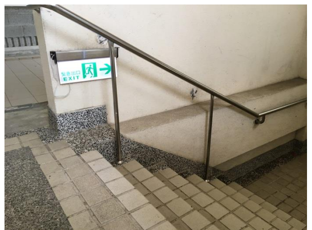
說明：校園無障礙樓梯扶手欄杆及避難指示設施