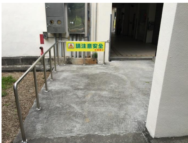
說明：校園交通安全提示及防護