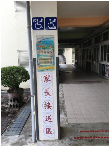
說明：校園無障礙設施標示