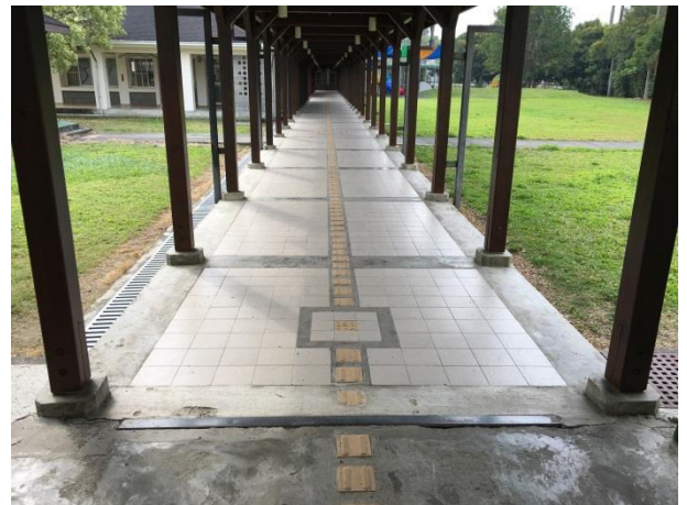
說明：校內走廊設置分隔線，學生依規定行走。