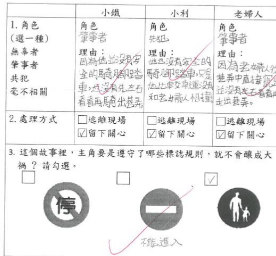
說明：高年級交通安全課程並完成學習單。

小鐵和小利兩人是國小六年級的學生，放學後在昏暗的巷弄中，橫衝直撞的騎腳踏車，一會兒蛇行變換車道，一會兒放手表演特技，互相併排嬉鬧，完全沒注意到危機已悄悄靠近。一名老婦人趕著滿手的塑膠袋從巷弄中直接竄出，正好與小鐵的自行車迎面撞上，老婦人跌坐在地上痛苦哀號．．．．．故事接下來，由你完成。