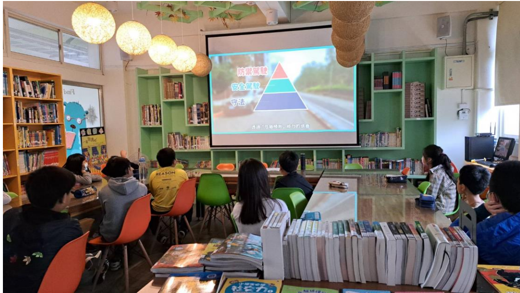
說明：高年級交通安全課程。