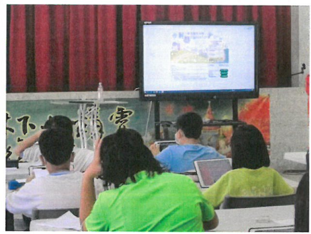
說明：成長測驗實施照片