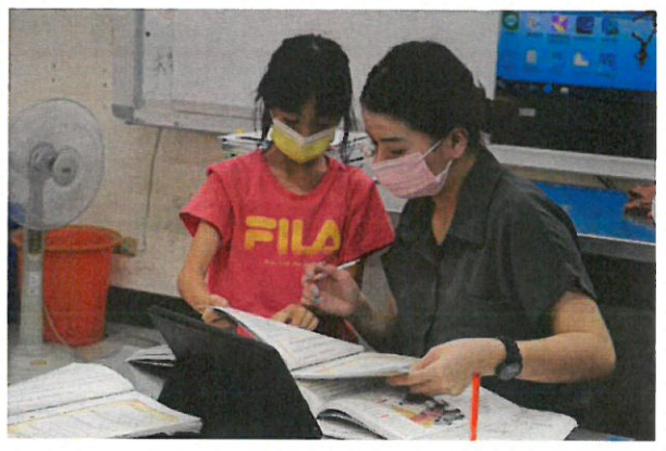
說明：學習扶助班上課教學照片