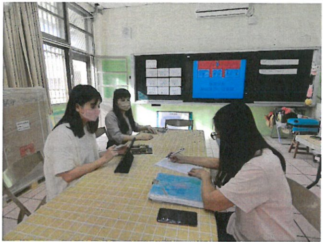
說明：學習輔導小組會議照片