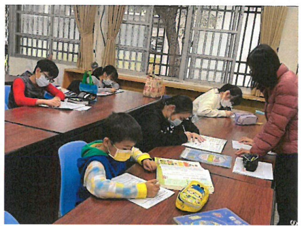
說明：學習扶助班上課教學照片