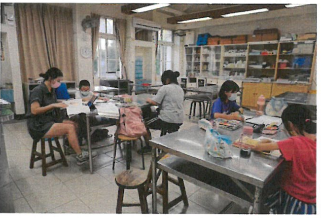
說明：學習扶助班上課教學照片