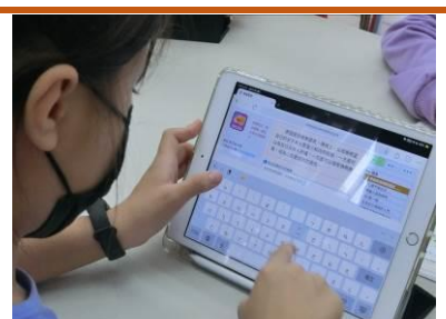
學生進行自主學習