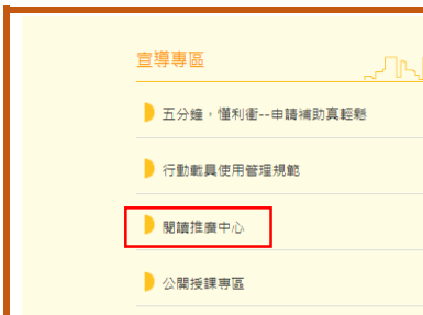
台灣閱讀推廣中心

在學校網站的宣導專區放置台灣閱讀推廣中心的連結方便教師設計課程運用，並鼓勵學生利用課餘時間進入數位讀寫網進行自主學習，提高閱讀及寫作能力。